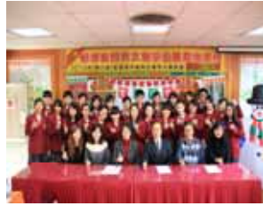
2012 年全國英文單字高中組冠軍- 高雄市教育局科長蒞校鼓勵