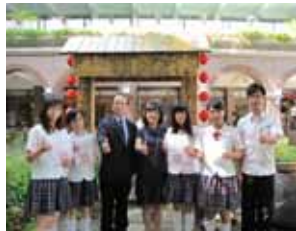
2013 年台南應用科技大學全國高職 專題製作比賽榮獲語言類組第一名