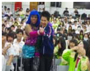
2012 空中英語教室蒞臨樹德家商 巡迴演出“黑珍珠”與學生互動