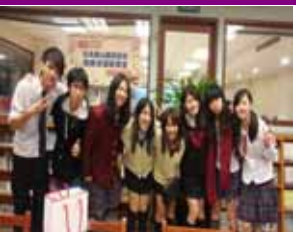
2012 年第十屆亞洲學生交流活動 專題製作比賽榮獲“黃金獎”