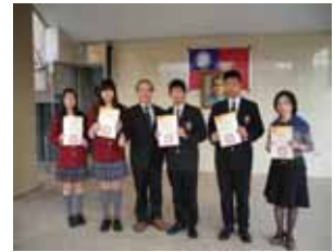
2012 年教育部英語說故事比賽 應用外語組全國第一名