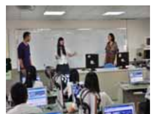
外籍老師於語言教室教學