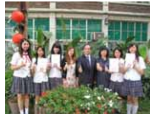
2013 年台南應用科技大學全國高職 專題製作比賽榮獲其他類組第一名