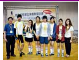
2012 年技職院校策略聯盟 專題製作競賽 特優獎