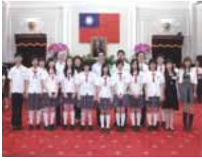
2012 國際學校網界博覽會 榮獲白金獎 獲總統府邀請與總統合影