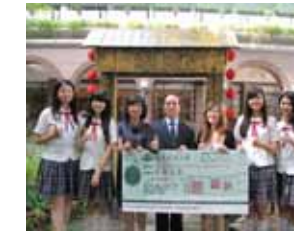
2013 年遠東科技大學全國高中職 專題製作比賽榮獲其他類組第一名