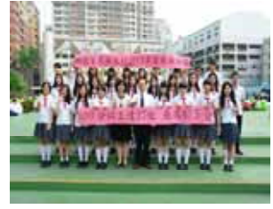
2013 年 3 月多益測驗 28 位 600 分以上，7 位 800 分以上