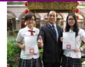
2012 年高雄市教育局中等學校英文作文 比賽榮獲個人組第四名及第六名