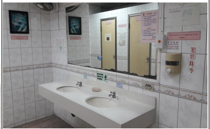
友善通知及標語宣導