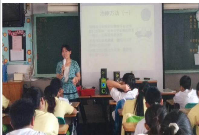
傳染病防治—登革熱