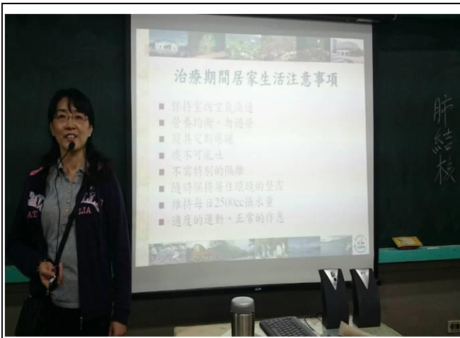
傳染病防治—肺結核