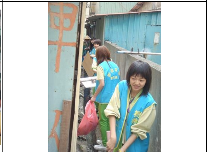
學生利用社團課將校外周遭髒污處清除乾淨