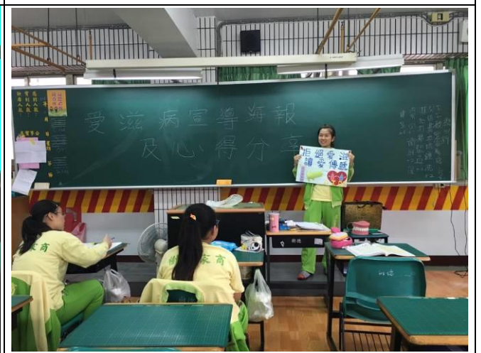
學生製作愛滋病防治宣導海報及上台分享