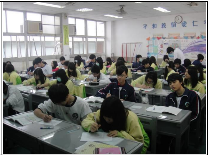
學生書寫學習單及計算自己的BMI