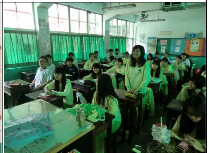
學生發表課程相關心得