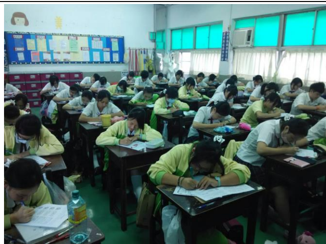
學生書寫菸害防制學習單