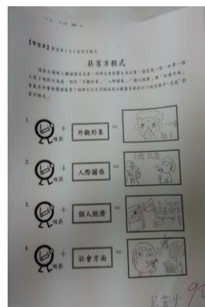
學生菸害防制學習單呈現