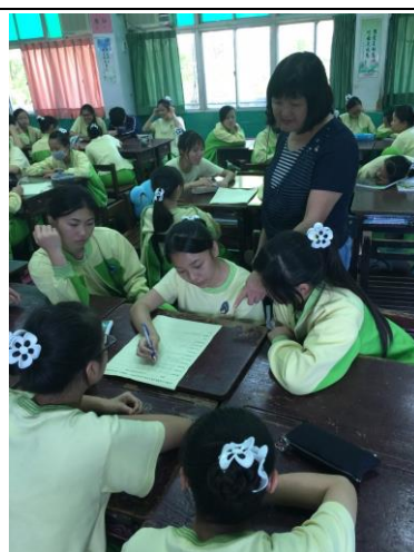
學生討論菸害防制學習單