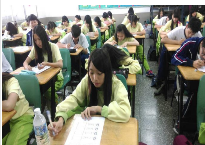
學生書寫菸害防制學習單