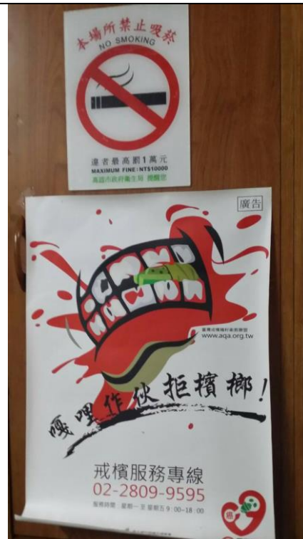
說明：會議室門口張貼海報