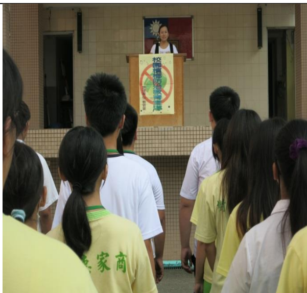
說明：週會時由衛生組長實施校園反菸檳宣導