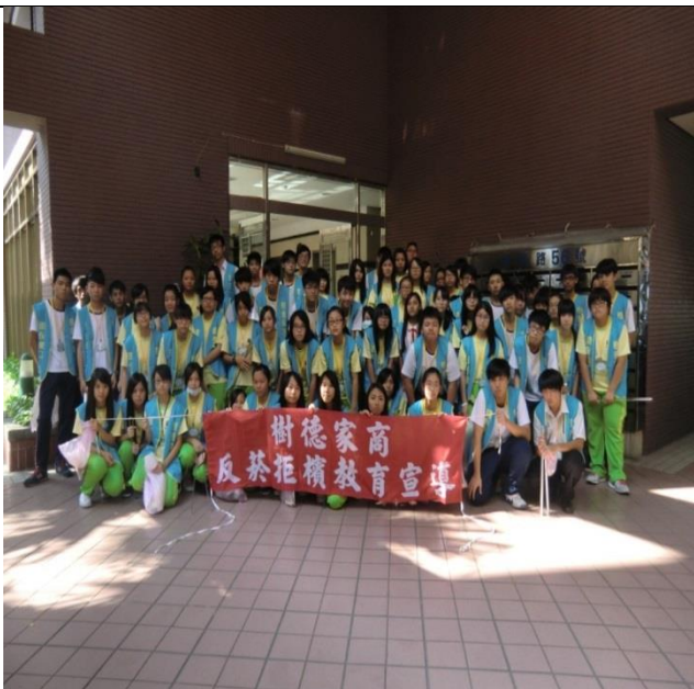
說明：結合敦親睦鄰社區打掃活動加強反菸拒檳宣導