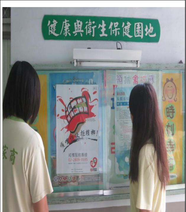
說明：校園保健室外公佈欄標語張貼