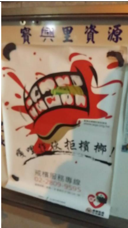
說明：資源回收公布欄張貼海報