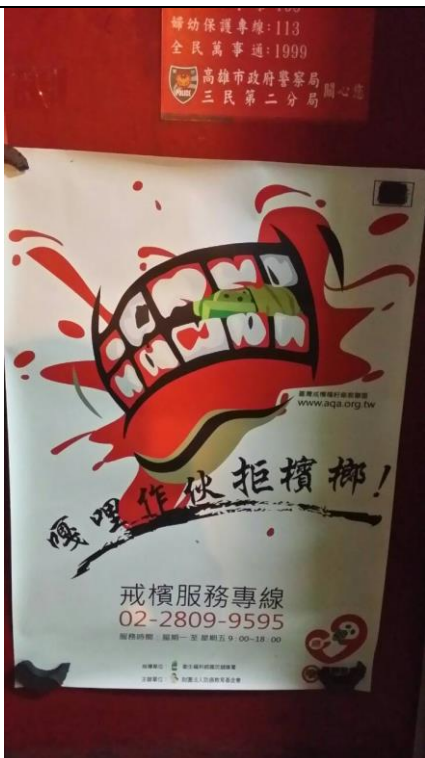
說明：警察局公布欄張貼海報