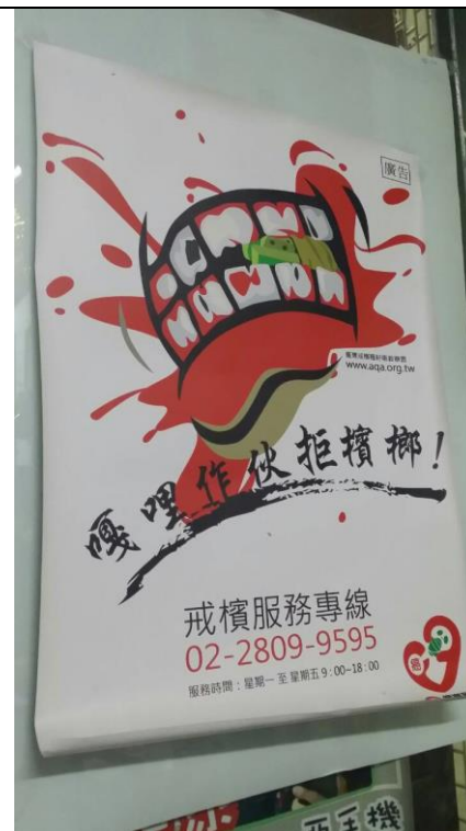
說明：社區公布欄張貼海報