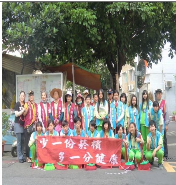
說明：強化學校與社區(寶興里)行動力，共創無菸檳之社區